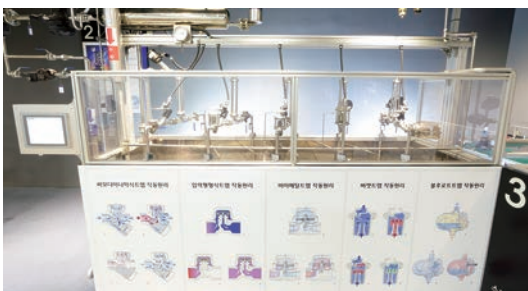
03 스팀트랩 파이롯트 장치 종류별 트랩 작동원리, 스팀트랩 스테이션, STAPS 무선 스팀트랩 모니터링 시스템