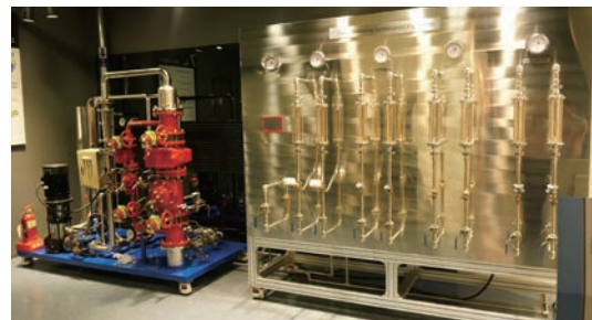
07 수배관 시스템 파이롯트 장치 밸런싱 시스템, OCV 소방용 감압밸브 패키지