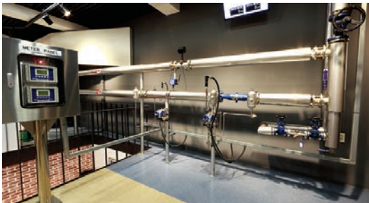
01 유량 측정 시스템 파이롯트 장치 종류별 유량계 비교, Wireless TVA

기술연수원 실습실은 스팀 및 유체 시스템에서의 필요한 각 장치의 작동원리와 시스템을 직접 경험할 수 있도록 각 장치별로 유리관을 통해 작동되는 모습을 눈으로 확인하실 수 있습니다. 각 파이롯트 장치별 원격 및 로컬에서 컨트롤할 수 있는 PC가 구성되어 있고 각 장치를 실제 가동해 보실 수 있어 보다 효과적인 견학과 실습이 가능합니다.