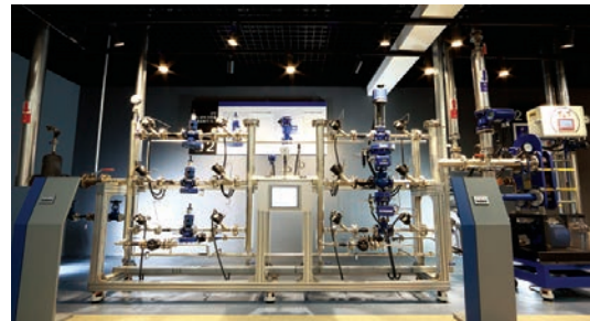
02 압력, 온도 컨트롤, 열교환기 파이롯트 장치 감압밸브, 컨트롤밸브, 열교환기