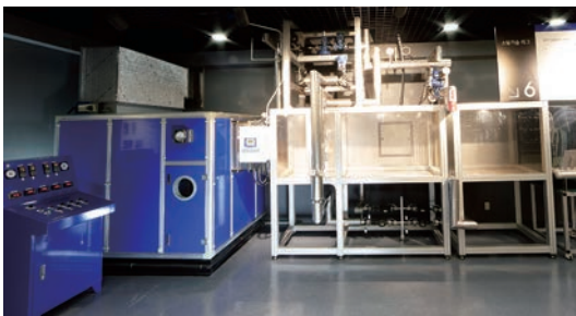
06 스팀 가습 파이롯트 장치 종류별 분사기 비교