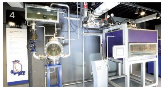
04 응축수 회수 펌프의 작동원리, 응축수 회수 시스템 05 스팀 직접 분사 파이롯트 장치 종류별 분사기 비교, 진공해소장치