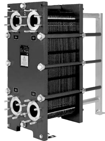
T10B-FG 물용 열교환기