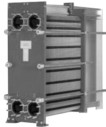
M20-MFG 물용 열교환기