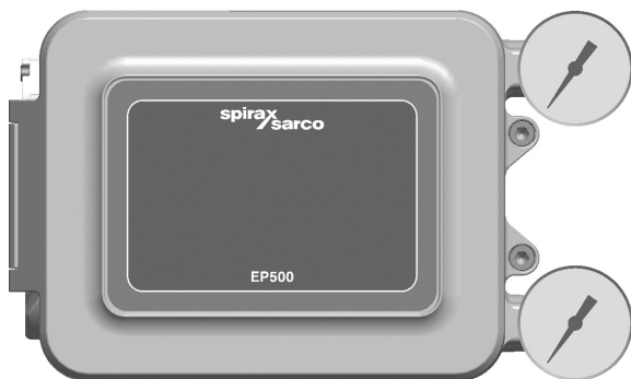
EP500 con pannello frontale chiuso