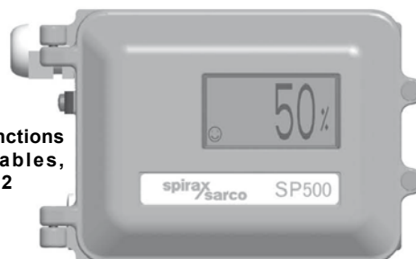
SP500 avec couvercle frontal fermé

Pour les fonctions programmables, voir la page 2