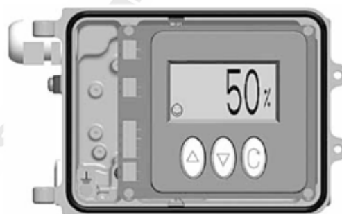
SP400 avec couvercle frontal retiré