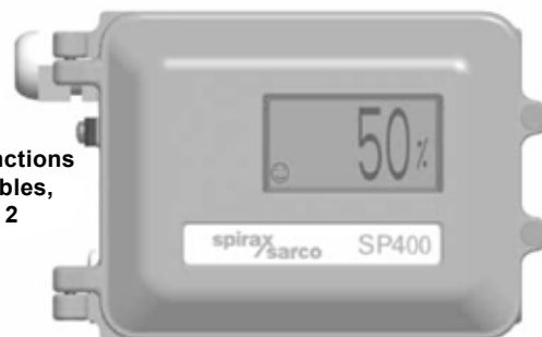
SP400 avec couvercle frontal fermé

Pour les fonctions programmables, voir la page 2