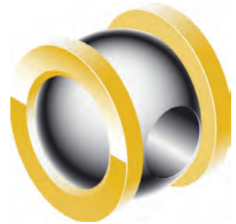
Fig. 1 - Sphère et sièges

Les robinets à tournant sphérique Spirax Sarco couvrent une large gamme d'utilisations en pression et température. Robinet universel adapté à un grand nombre de fluides, le boisseau sphérique est simple d'utilisation et d'entretien et très facilement motorisable.