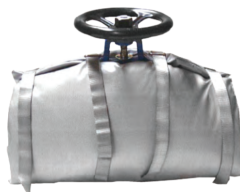
Matelas plats pour robinet

Les matelas plats "standards" pour nos robinets et vannes sont tenus en stock.