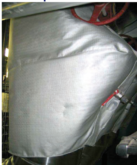
Matelas préformé pour filtre