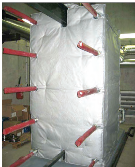
Matelas préformé pour échangeur à plaques