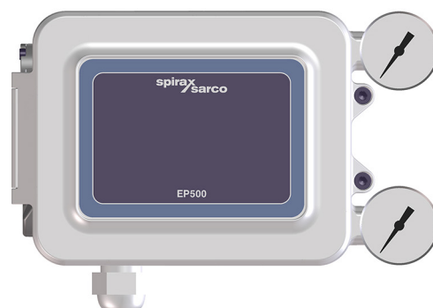
EP500 avec couvercle fermé

Avec un réglage simple, les positionneurs peuvent être utilisés pour un fonctionnement séquentiel de deux ou plusieurs vannes pneumatiques de manière à ce que la course de chaque vanne soit obtenue par un signal de commande split-range. Le positionneur électropneumatique EP500 peut également être utilisé pour inverser l'action du signal de commande.