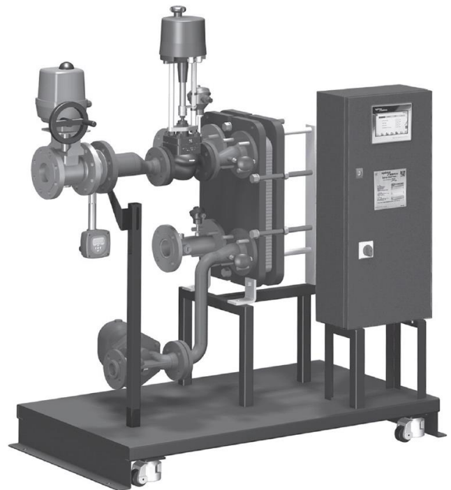
(exemple d'un Spirax EasiHeat™ HTG type EHHSC)

Le débitmètre à orifice variable a été spécialement conçu pour une mesure de débit précise et une rangéabilité importante sur des applications vapeur. Il est une composante clé de l'EasiHeat™ HTG garantissant une mesure précise de la consommation énergétique et permettant le contrôle des coûts.