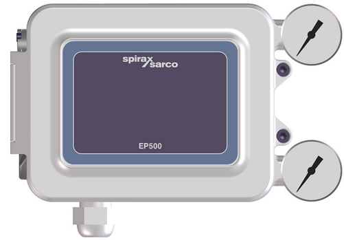
EP500 con la tapa frontal cerrada