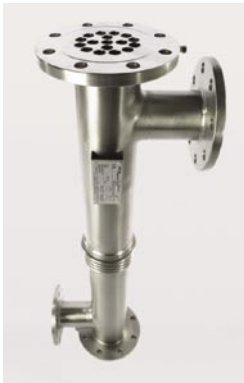
Intercambiador de tubos