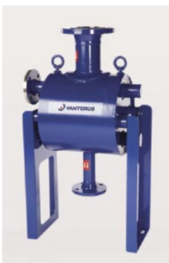
Intercambiador Plate & Shell®